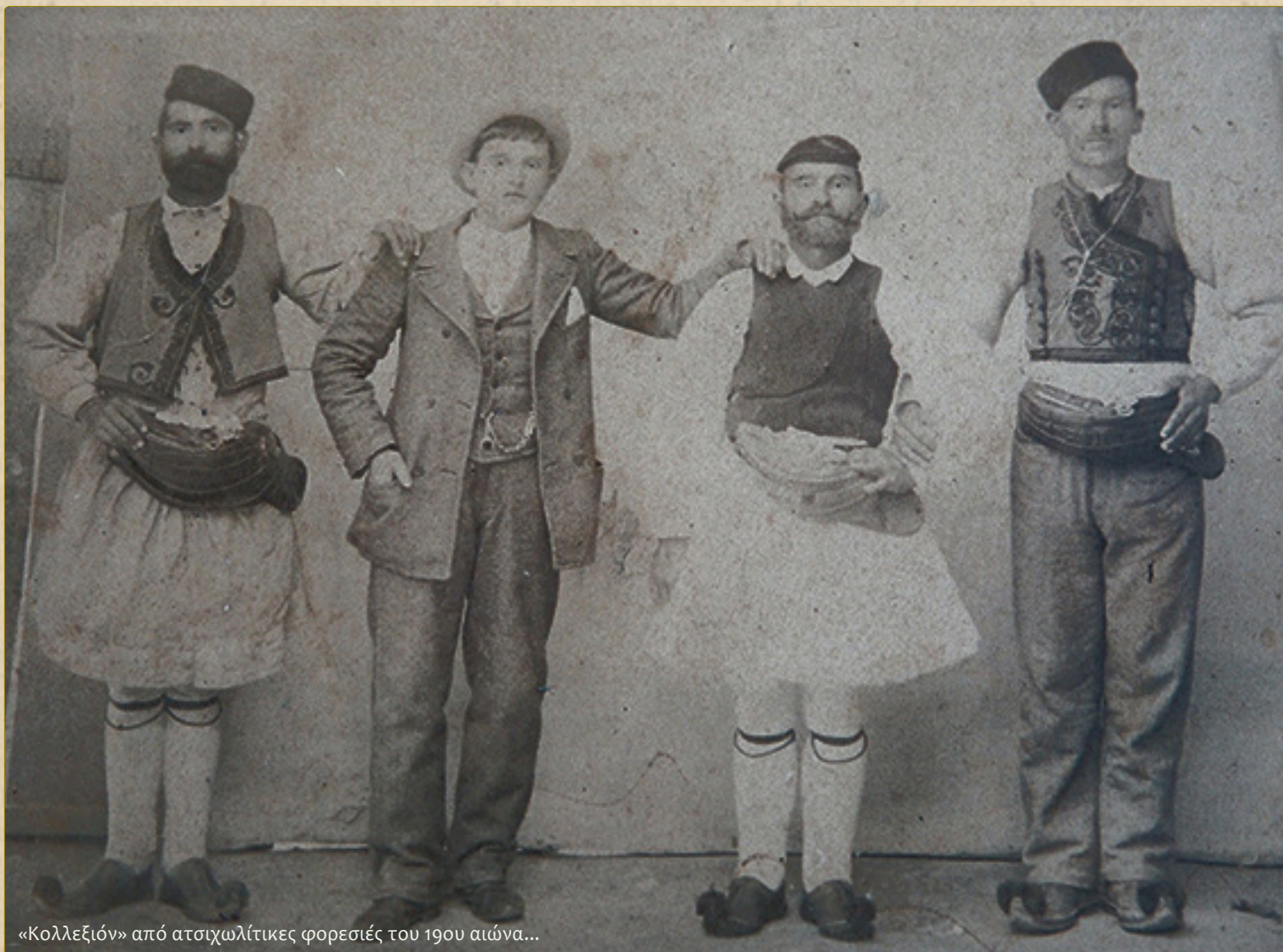
«Κολλεξιόν» από ατσιχωλίτικες φορεσιές του 19ου αιώνα...