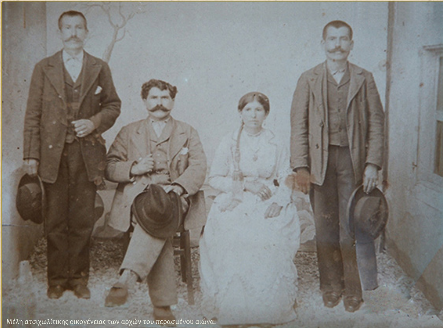
Μέλη ατσιχωλτίτικης οικογένειας των αρχών του περασμένου αιώνα.