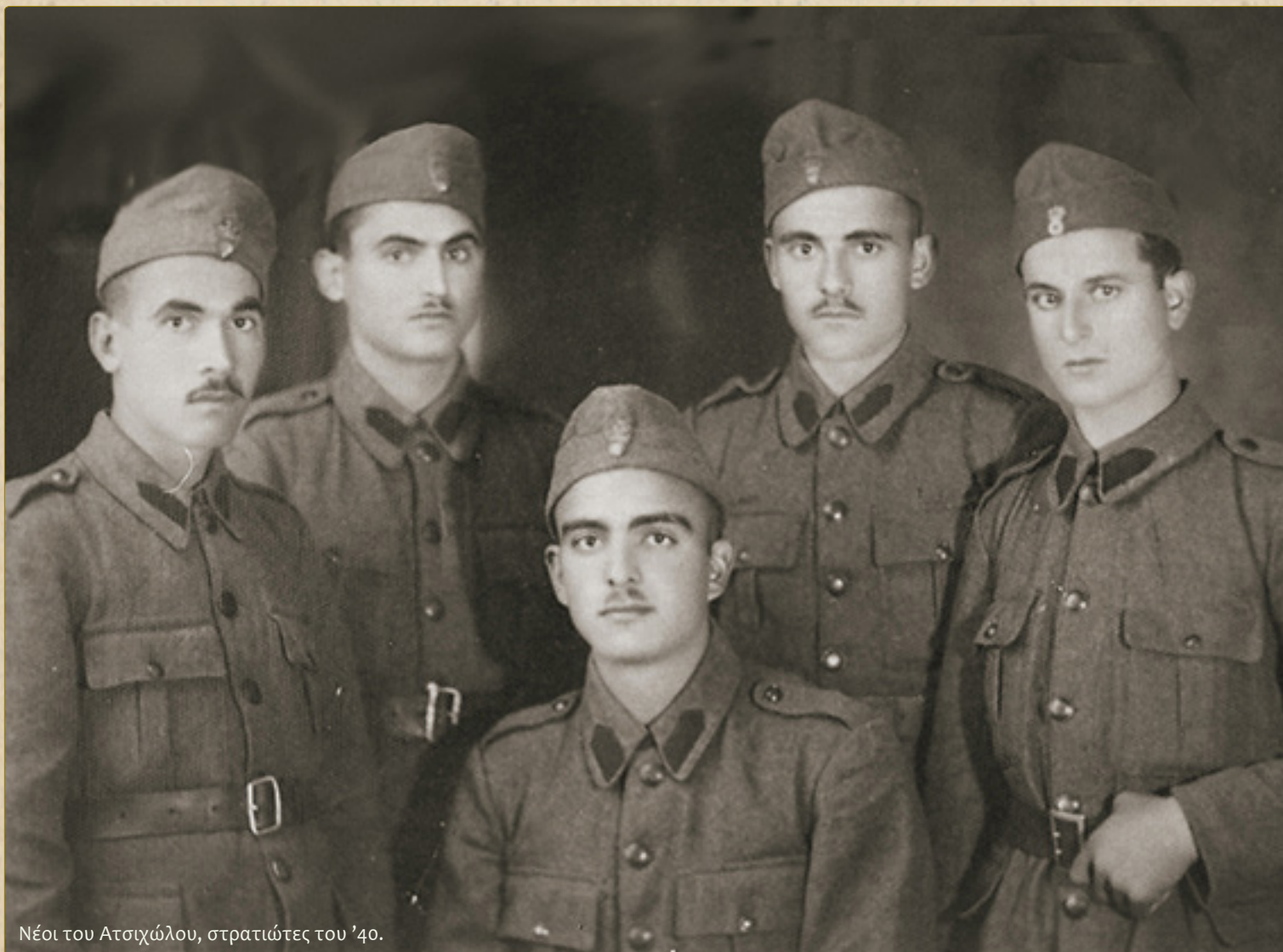
Νέοι του Ατσιώλου, στρατιώτες του '40.