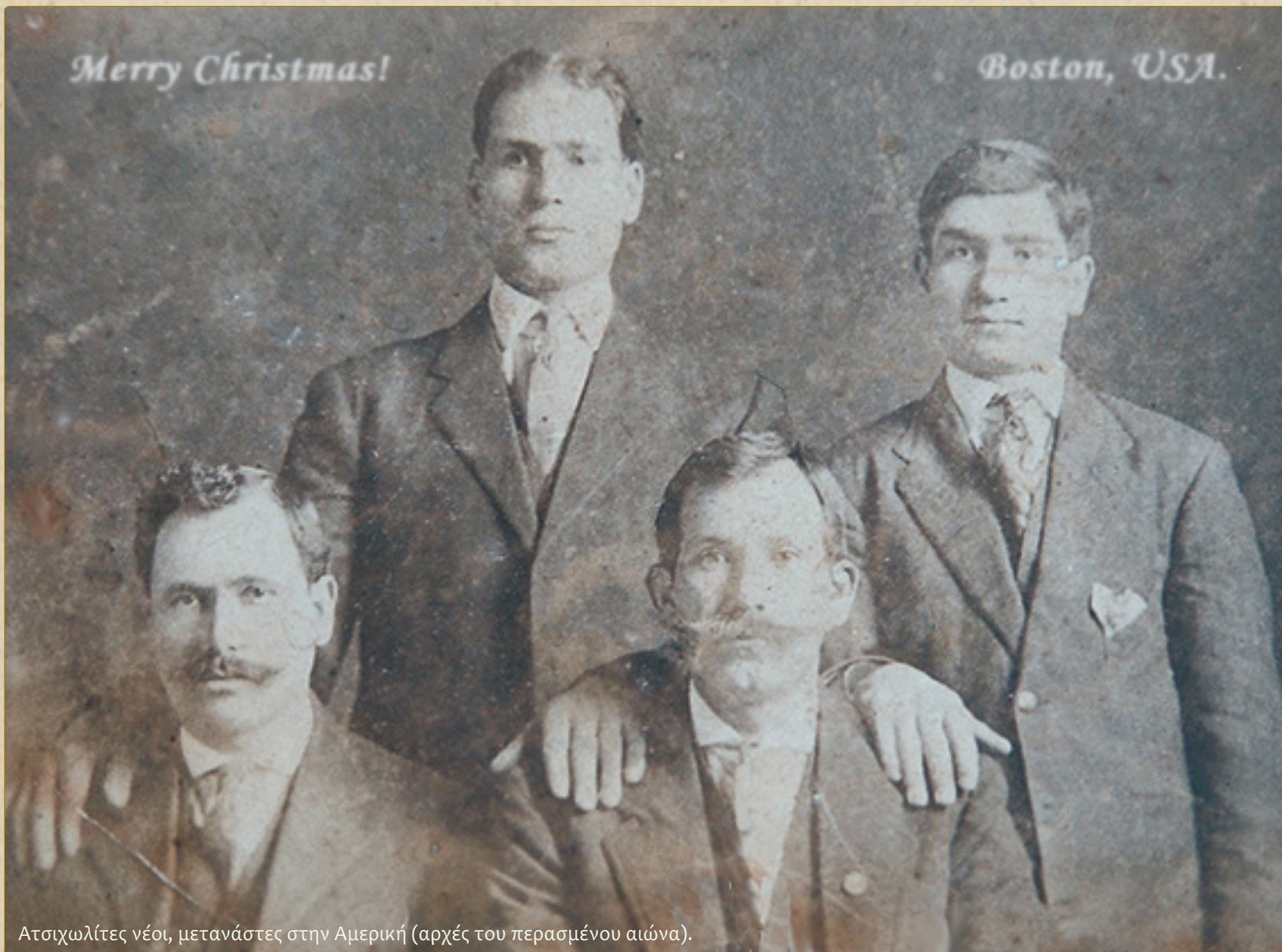
Ατσιχωλίτες νέοι, μετανάστες στην Αμερική (αρχές του περασμένου αιώνα).