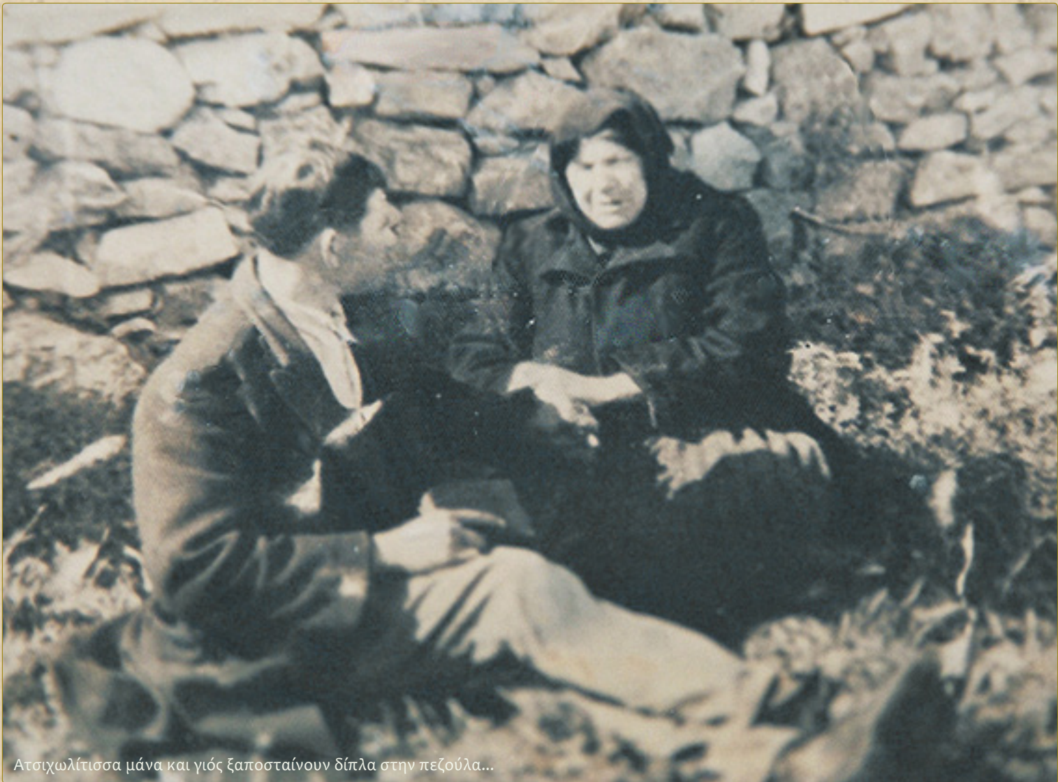
Ατσιωλίτισσα μάνα και γιός ξαποσταίνουν δίπλα στην πεζούλα...