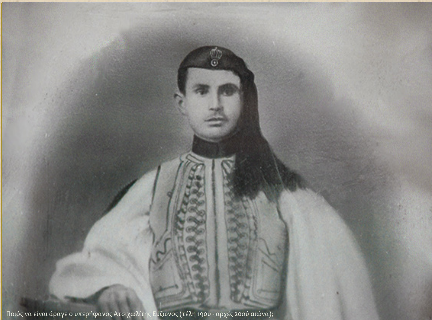
Ποιός να είναι άραγε ο υπερήφανος Ατσιχωλίτης Εύζωνος (τέλη 19ου - αρχές 20ού αιώνα);